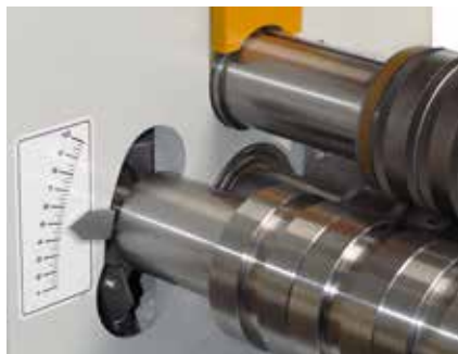
Skala für Radiuseinstellung