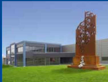
Effringen - Werk und Kunstobjekt