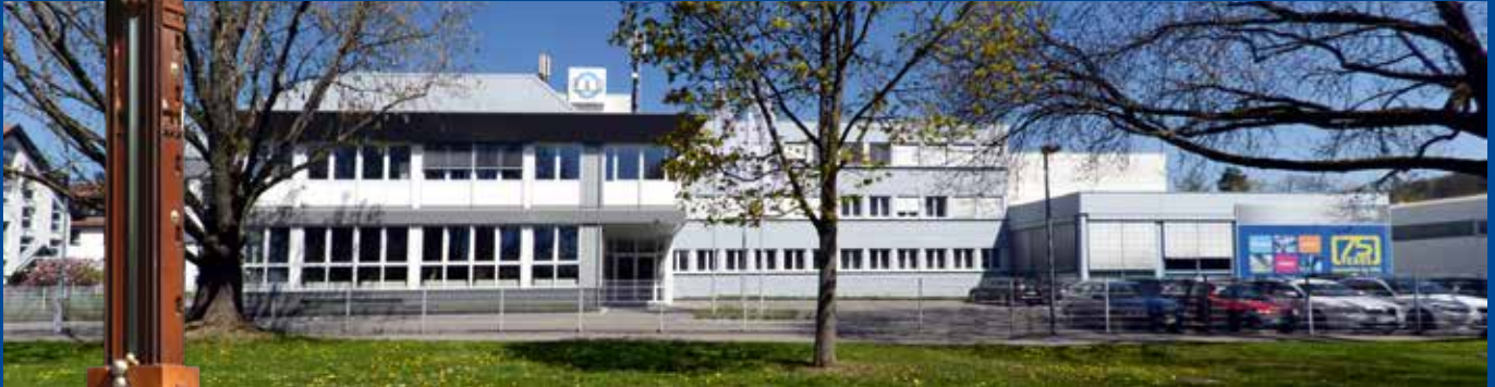
Hauptsitz in Sindelfingen. Im Vordergrund Kunstwerk „Stahlobjekt“.