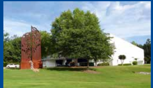
RAS Systems LLC in Georgia, USA

Alle Blechdickenangaben beziehen sich auf 400 N/mm 2 Zugfestigkeit. Änderungen vorbehalten. Abbildungen können Optionen enthalten.