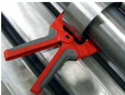
Die Haltezange verhindert eine Durchbiegung der Wellen.