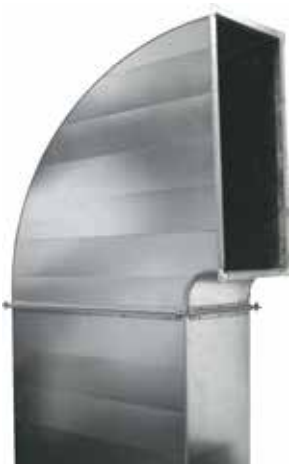
Zum Runden von Mantelbögen mit anprofiliertem Falz.