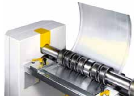
Wellenringe auf Teilebreite anpassbar