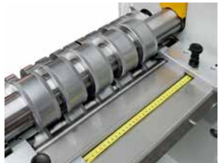
Maßband für eine schnelle Voreinstellung.